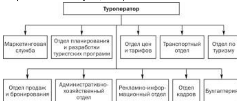
Рисунок 2 – Структура управления

Слово «Рисунок» и наименование помещают после пояснительных данных и располагают следующим образом: